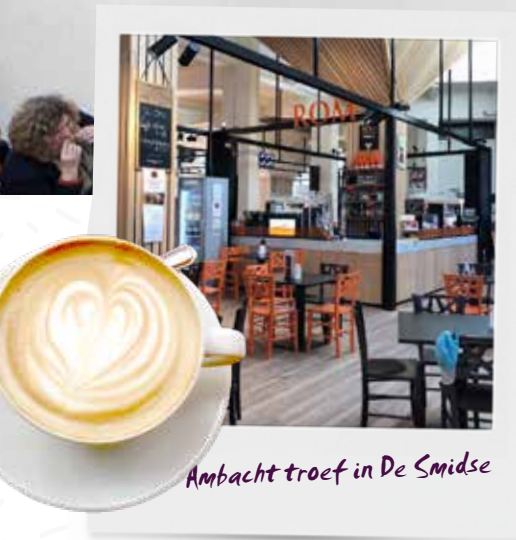
Ambacht troef in De Smidse