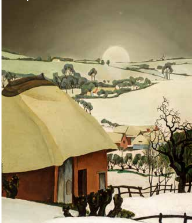
Valerius De Saedeleer, Winter (ca. 1926), Verzameling 't Gasthuys - Stedelijk Museum Aalst.