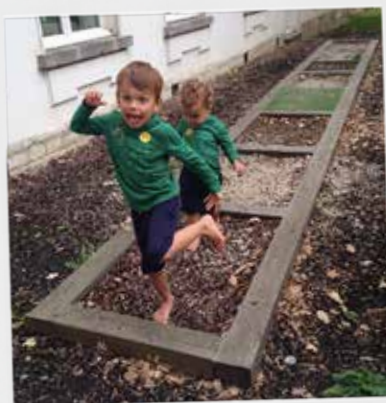
Op blote voeten in de tuin van M-Museum