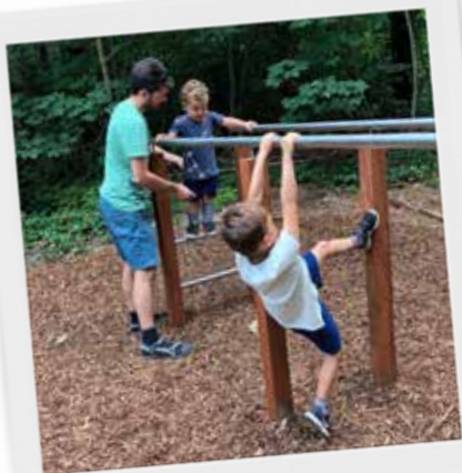
Toffe uitdagingen in Heverleebos!