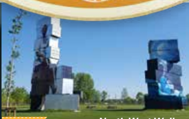
North West Walls

Meer dan 35 brouwerijen en 470 bieren en dan hebben we de bruine kroegen nog niet geteld. Het brouwen van bier zit al eeuwen in de Vlaams-Brabantse genen. Je proeft de brouwtraditie tijdens boeiende brouwerijbezoeken, toffe fiets- en wandelroutes en proeverijen op unieke locaties. (H)echte biermomenten, het hele jaar door.